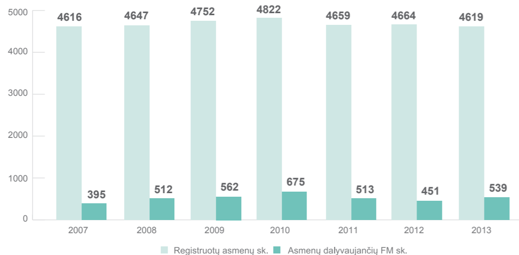
2 pav. Asmenų, registruotų dėl psichikos ir elgesio sutrikimų, atsiradusių vartojant opioidus, ir gaunančių pakaitinį gydymą, skaičius Lietuvoje 2007–2013 m. gruodžio 31 d.

2013 m. pabaigoje FOV buvo taikomas 539 pacientams ir tai sudarė 11,6 procentų nuo visų 4 619 asmenų, registruotų dėl psichikos ir elgesio sutrikimų, atsiradusių vartojant opioidus. 2012 m. ši dalis buvo 9,7 proc. (451 iš 4 664), 2011 m. – 11 proc. (513 iš 4 659), 2010 m. – 14 proc. (676 iš 4 822). Gydymas metadonu 2013 m. sausio 1 d. Lietuvoje buvo taikomas 518 asmenų, per 2013 metus 240 pradėjo gydymą, 197 baigė gydymą, o 2013 m. gruodžio 31 d. buvo gydomas 321 asmuo. Pakaitinis gydymas buprenorfinu 2013 m. sausio 1 d. Lietuvoje buvo taikomas 74 asmenims, per 2013 metus gydymą pradėjo 67 asmenys, o baigė tik 5 12 .