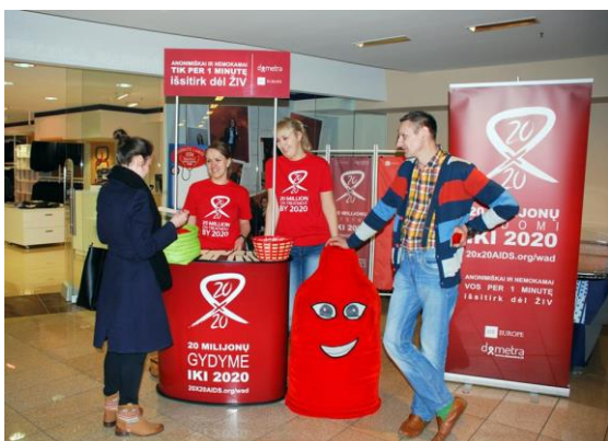
Nuotraukoje: renginio CUP akimirka